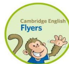
Cambridge English: Flyers

Nuestros alumnos preparan el examen de Movers (A1) en los cursos de 3º y 4º, presentándose al finalizar 4º. Constituye la forma perfecta para ayudar a los niños a desarrollar sus destrezas lingüísticas y avanzar en su aprendizaje.