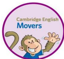
Cambridge English: Movers

Nuestros alumnos preparan el examen de Starter (Pre A1) en los cursos de 1º y 2º, presentándose al finalizar 2º. Constituye el inicio de aprendizaje de idiomas.